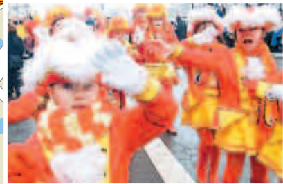
So ausgelassen feiern die Jecken Karneval in Berlin