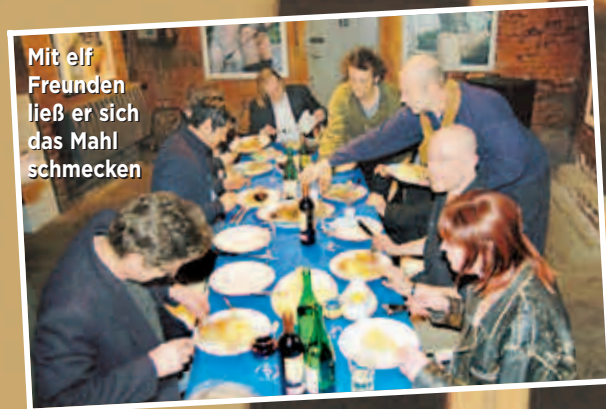
Mit elf Freunden ließ er sich das Mahl schmecken